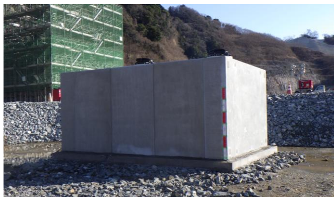
<②管理施設エリアの防火水槽>