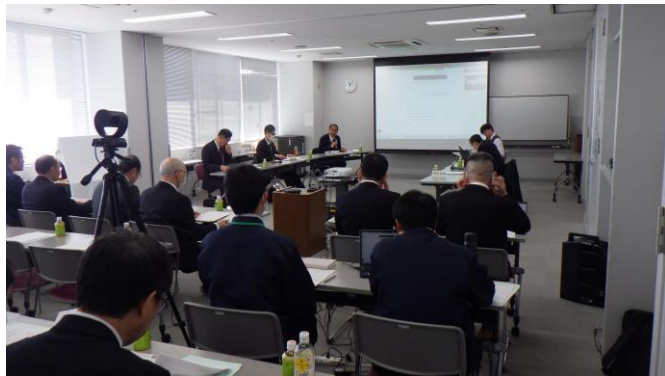
<有識者会議開催の様子>

また、当日は有識者による現地視察も行われ、工事の進捗や施工状況を確認していただきました。