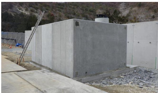
<①防災調整池北側の防火水槽>

防火水槽は、40 \text{m}^3 の貯留容量と耐震性を備えたコンクリート製品で、設置場所は、①防災調整池の北側と②管理施設エリアの2箇所となります。