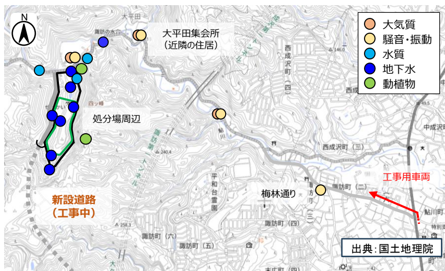
処分場建設工事中の環境モニタリング実施地点