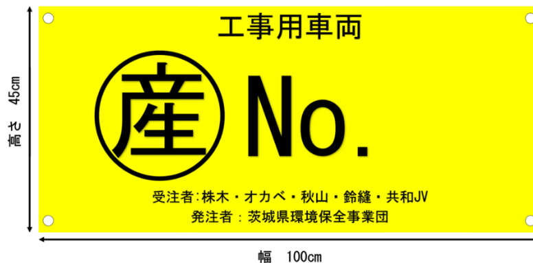
<工事用車両に掲示するゼッケン>

また、法定速度の遵守、運転マナーの徹底等を図るため、元請業者から運転管理者に対し、別紙4の文書による事前指導を行っておりますが、万が一違反行為を見かけた場合には、事業団までご連絡いただきますようお願いいたします。