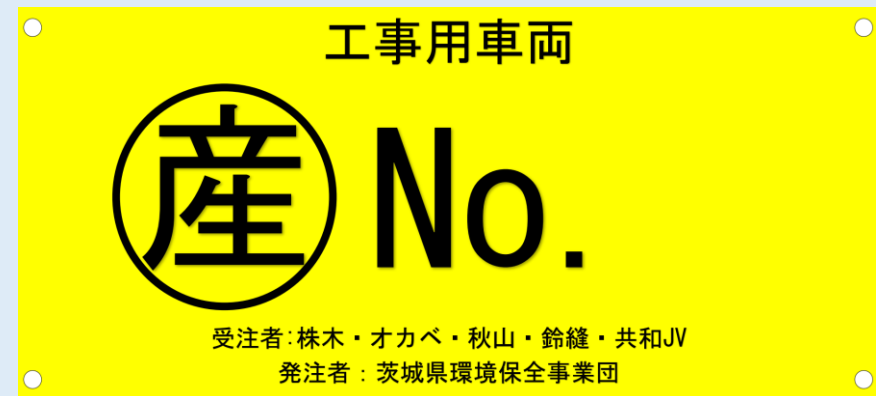
図2 工事用車両の掲示物